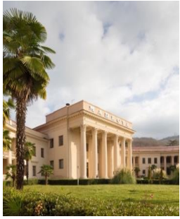
Санаторно-курортная диагностика и профилактика