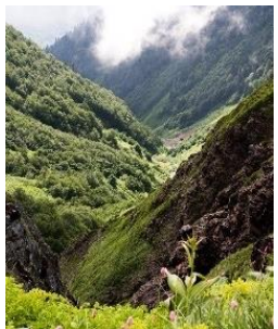
Парки и заповедники

Погружение в мир развлечений и впечатлений