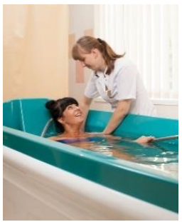
Санаторно-курортное лечение и реабилитация