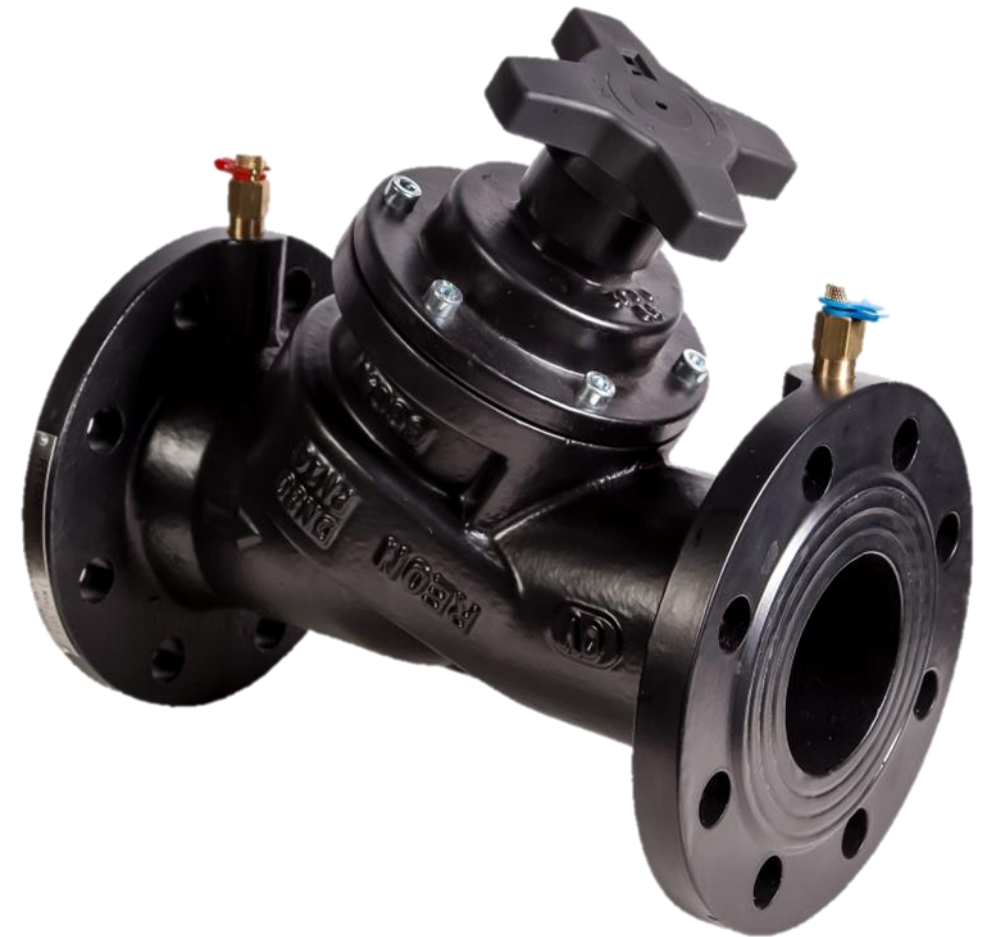
клапан балансировочный RSV55