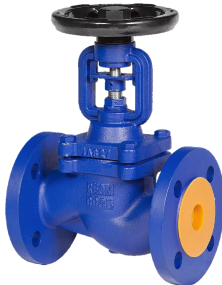
ВЕНТИЛЬ СИЛЬФОННЫЙ RSV17