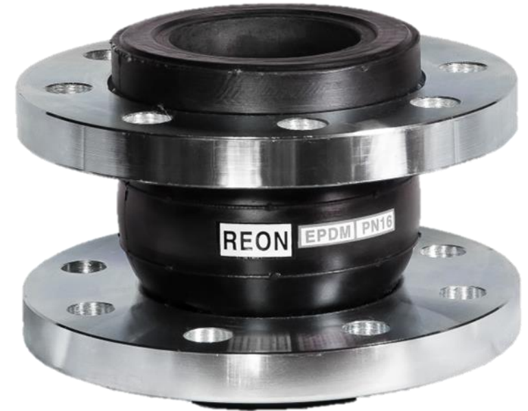
виброкомпенсатор фланцевый RSV12