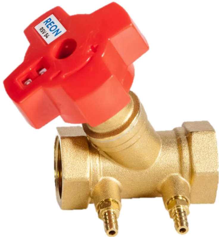
клапан балансировочный RSV54